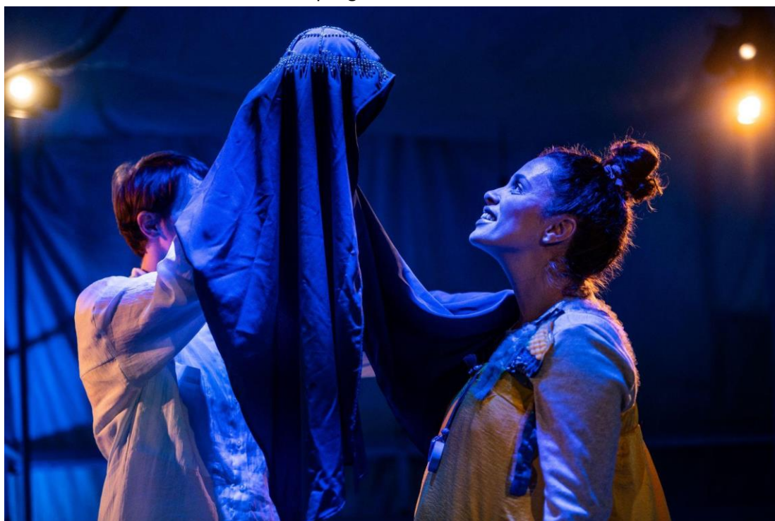
Scènefoto uit Het Mooiste Blauw